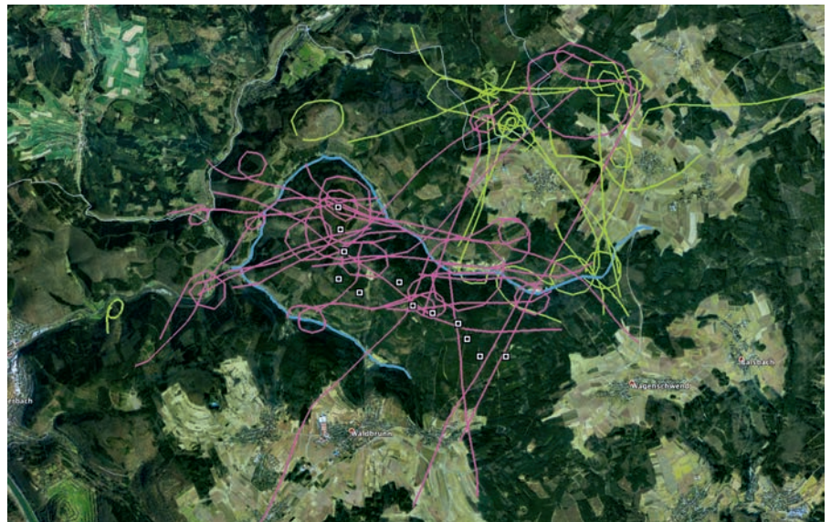
Abb. 2: Vorhabensgebiet zwischen Höllbach und Reisenbach mit zwölf projektierten Windenergieanlagen und im Untersuchungszeitraum 2014 kartierten Schwarzstorch-Überflügen (Abbildung aus ROHDE 2014).

Project area between Höllbach and Reisenbach including the planning of 12 wind power plants; during the investigation period in 2014 the flyover of the Black Stork has been mapped (Illustration from ROHDE 2014).