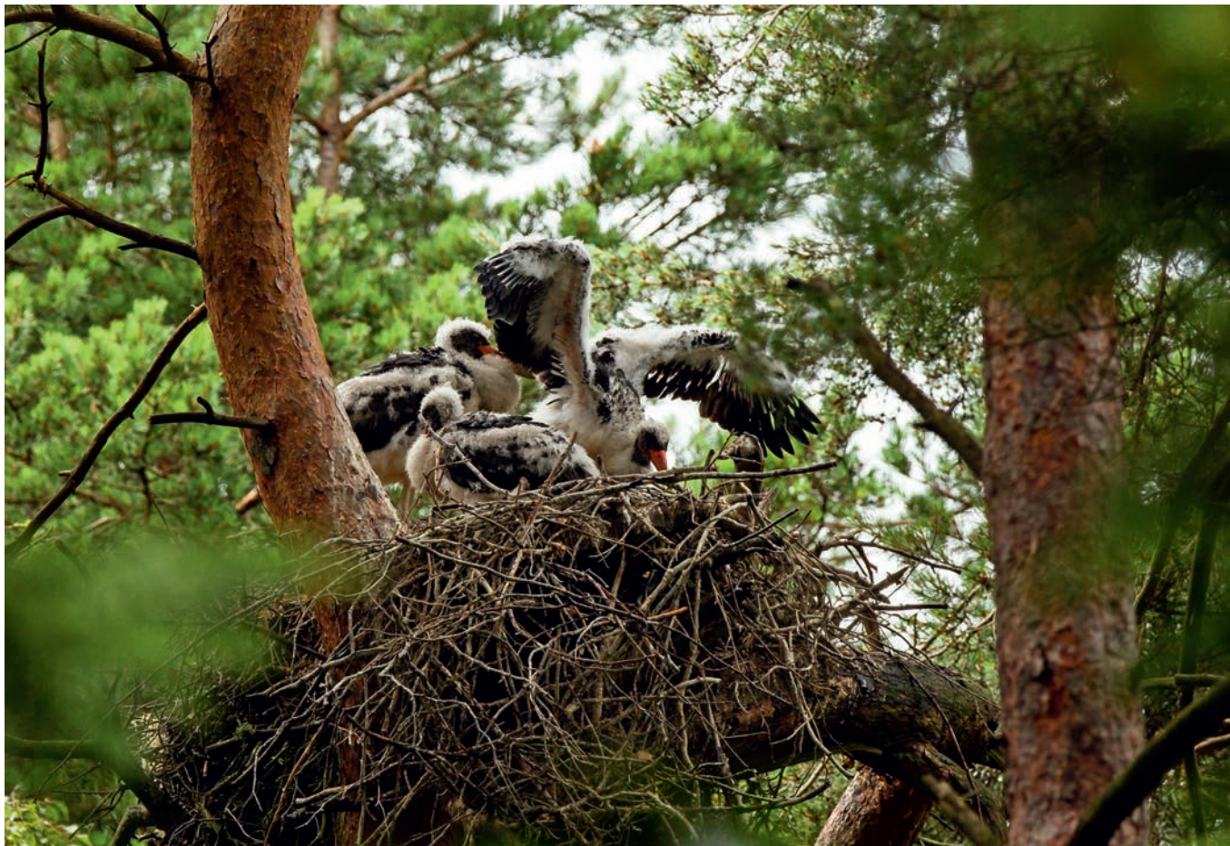
Abb. 4: 2014 mit Bruterfolg besetzter Schwarzstorchhorst im Prüfbereich. Aerie of the Black Stork in the investigation area, successful breeding in 2014.