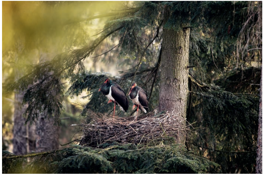
Abb. 7: Schwarzstorchhorst auf einer Weißtanne ( Abies alba ), ermittelt durch Raumnutzungsanalyse mit erstklassiger Methode und Artenkenntnis.

Damit solche artenschutzfachlichen Konstellationen überhaupt nachgewiesen werden können, sind profunde Raumnutzungsanalysen erforderlich, um im Prüfbereich der betreffenden Arten „die essentiellen Nahrungsgebiete bzw. die regelmäßig erschlossenen Flugtrassen zu den ausschlaggebenden Nahrungsgebieten auszuweisen und im Ergebnis folgerichtig von Windenergieanlagen freizuhalten“ (ROHDE 2009: 191). Nicht selten konzentriert man sich beispielsweise beim Schwarzstorch, parallel zu unzureichend durchgeführten Raumnutzungsanalysen, zu starr auf eine