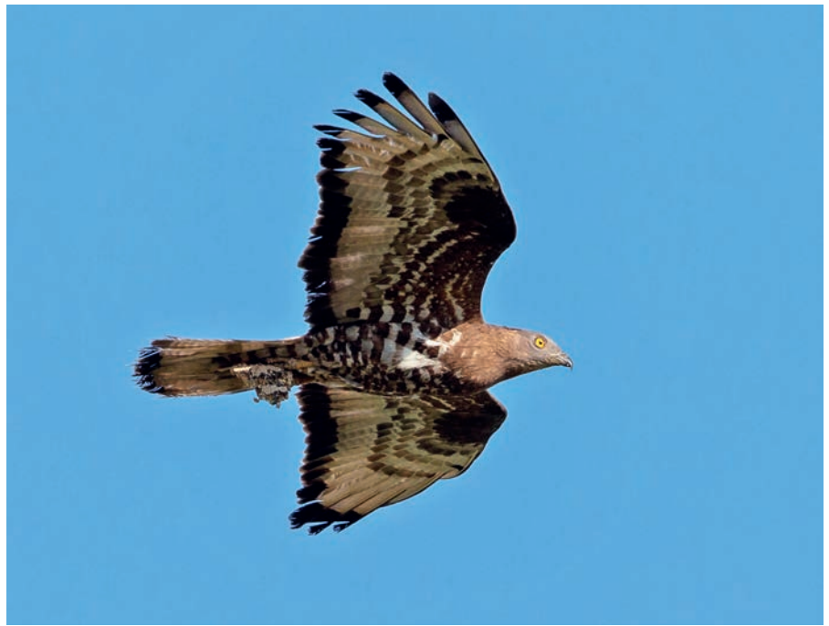
Abb. 3: Wespenbussard ( Pernis apivorus ). Honey Buzzard ( Pernis apivorus ).

Erst wenn es an „zumutbaren Alternativen“ tatsächlich fehlen sollte, „darf eine Ausnahme nur erteilt werden, wenn der Erhaltungszustand der Populationen der hiervon betroffenen Art nicht leidet. ... Entscheidend ist, dass sich die Erhaltungssituation ... nicht nachteilig verändert. ... Dies führt dazu, dass etwa dann, wenn eine negative Entwicklung absehbar ist, stets von der Erteilung einer Ausnahme abgesehen werden muss“ (FALLER & STEIN 2014: 19). In einem Urteil des Verwaltungsgerichts Cottbus vom 07. März 2013 heißt es: „Mit Blick auf die Gewichtigkeit der in § 45 Abs. 7 Satz 1 BNatSchG genannten Ausnahmegründe ist das mit der Errichtung von Windenergieanlagen verbundene Interesse an der Energiegewinnung nicht als zwingender Grund des überwiegenden öffentlichen Inte-