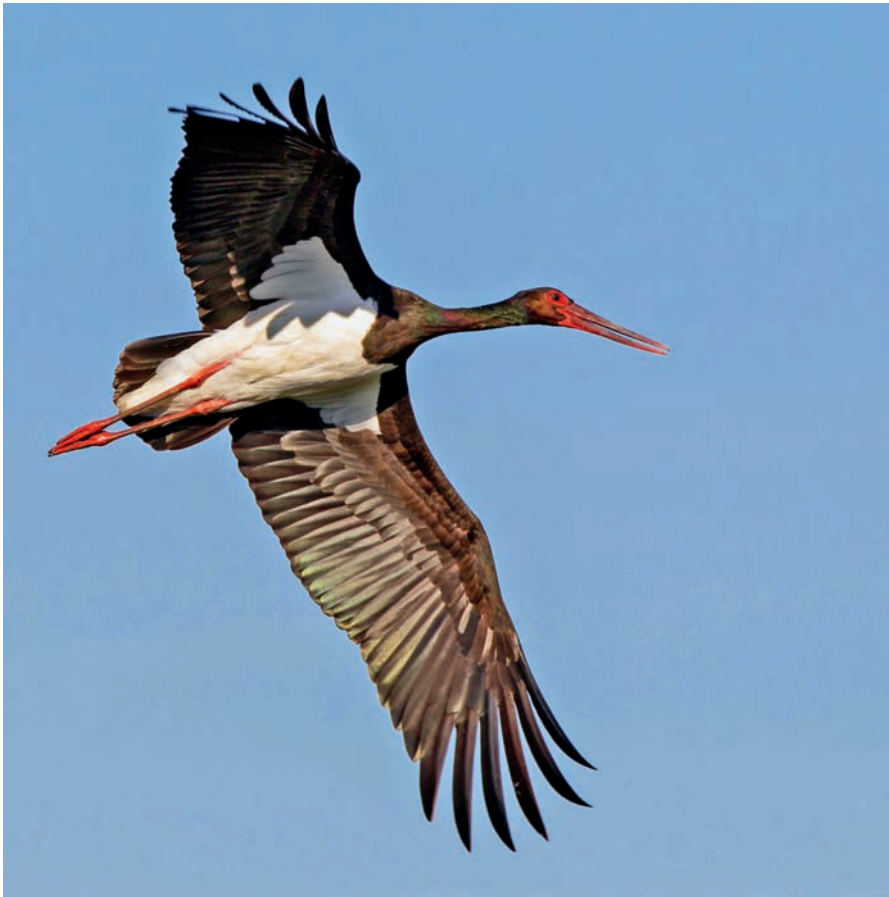
Abb. 1: Schwarzstorch ( Ciconia nigra ). Black Stork ( Ciconia nigra ).